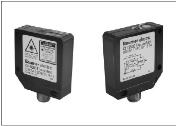
OSDM 16D9601/S14 OEDM 16P5101/S14

Лазерные датчики используют тогда, когда необходимо регистрировать объект маленького размера, или малой отражательной способности, например, фиксировать прохождение нити или проволоки, посчитать количество ножек у микросхемы и т.д. Лазерный луч этого датчика при помощи встроенной линзы фокусируется в точку диаметром 0,25 мм на расстоянии 0,4 м от излучателя, а потом опять расходится до 20 мм на расстоянии 10 м. Такая пространственная конфигурация луча позволяет регистрировать объекты размером до 1,6 мм во всем рабочем диапазоне от 0 до 8 м, а вблизи фокуса – объекты в доли миллиметра. Из-за малого расхождения луча и высокой концентрации света в узком пучке расстояние между приемником и излучателем можно увеличить до 10 м. Наличие механического потенциометра у приемника делает возможным тонкую настройку срабатывания в зависимости от прозрачности объекта. Датчик имеет двухцветный светодиод, который облегчает процесс подстройки.